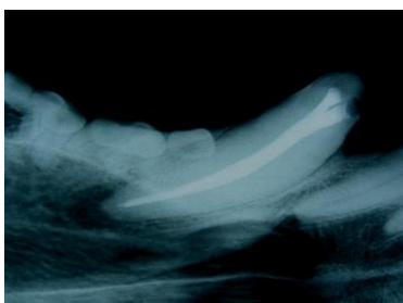
Wurzelkanalfüllung eines Caninus (Eckzahn) beim Hund

Das Praxisteam der Tierärztlichen Gemeinschaftspraxis am Kaßberg