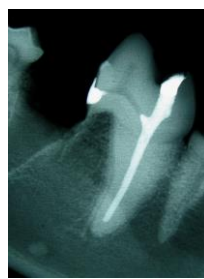
Entfernung einer zerstörten Zahnwurzel unter Erhalt der gesunden Zahnanteile